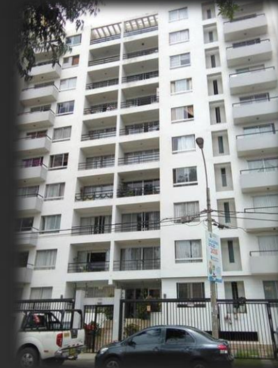
Torre Blanca JESÚS MARÍA