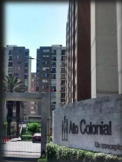
CONDOMINIO Alto Colonial Bellavista