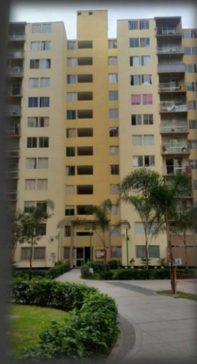
CONDOMINIO Parque Central CERCADO DE LIMA